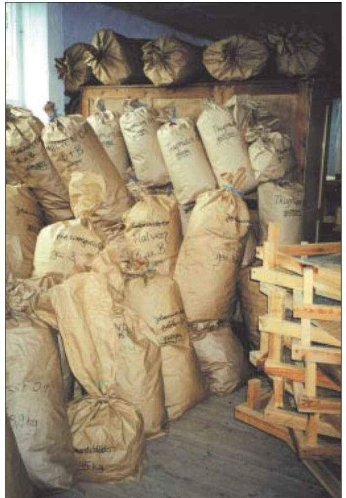
Einziges ostdeutsches Unternehmen mit einer einzigartigen ökologischen Produktpalette aus eigener Produktion.