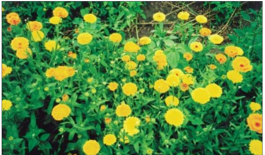
Prachtvolle Kräutergärten ...

Am 04. Juli 2001 wurde in Pulow in Ostvorpommern die Kräutergarten Pommerland eG als Produktivgenossenschaft gegründet. Hinter dieser schlichten Aussage verbirgt sich einerseits der Schlußpunkt intensiver Vorarbeiten, betriebswirtschaftlicher Planungen und Erprobungen von großflächigem Kräuteraanbau sowie der Entwicklung und Erprobung von Veredelungsprodukten. Andererseits war dies der von den Gründungsmitgliedern der Genossenschaft langersehnte Startschuß für die Aufnahme der Produktion und des Geschäftsbetriebs im eigenen Unternehmen.