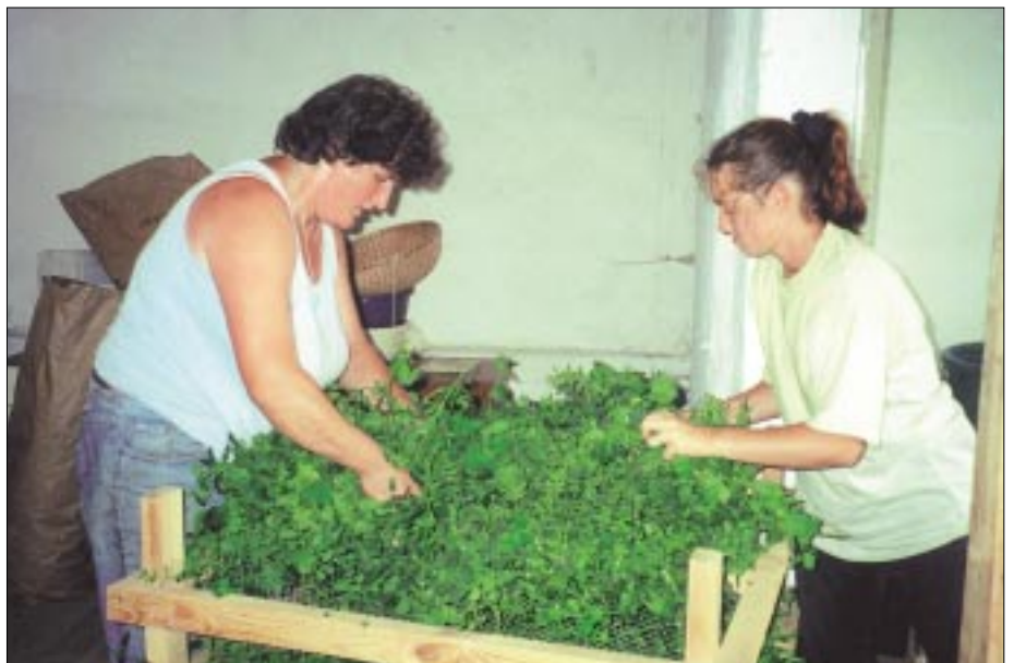
... und fachfrauliche Beratung

Ackerfläche gepachtet und auf diese Weise der großflächige Kräuteraanbau erprobt. Bis zum Jahr 2005 soll die Anbaufläche der Genossenschaft auf etwa 15 ha erweitert werden. Die Genossenschaft produziert ausschließlich nach den EU-Richtlinien für den ökologischen Kräuteraanbau und wird dementsprechend regelmäßig kontrolliert.