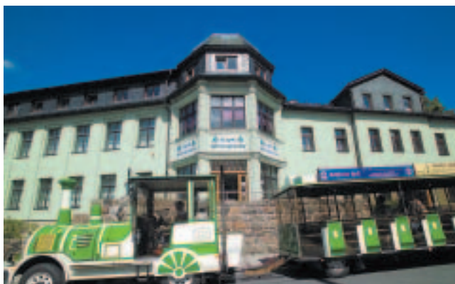
Über die Landesgrenzen hinaus bekannt: DREGENO eG aus Seiffen.