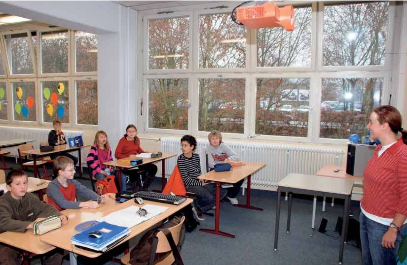
Die Schülerinnen und Schüler der 5. Klasse im Englisch-Unterricht. Deren Eltern sind Mitglieder der gemeinnützigen Träger-Genossenschaft.

schäftsanteile in Höhe von 5.000 Euro, verteilt auf drei Jahre, erworben.